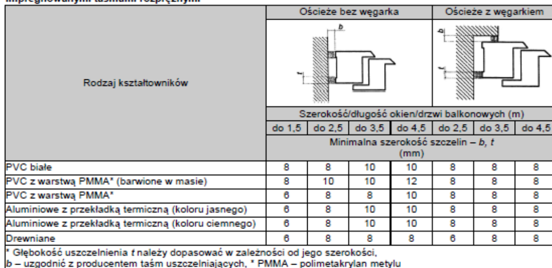
Tablica 4. Minimalna szerokość szczelin między ramą ościeżnicy a ościeżem przy uszczelnieniach impregnowanymi taśmami rozprężnymi*

Maksymalny wymiar szczeliny między ościeżnicą okienną a ościeżem nie powinien przekraczać 40 mm. Przy stosowaniu pianek jednoskładnikowych wymiar ten powinien wynosić maksymalnie 30 mm.